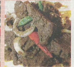
RENDANG daging antara sajian di KDE.

Sepanjang majlis berbuka puasa nanti, tetamu akan dihiburkan dengan nyanyian dan muzik ghazal dari Johor.